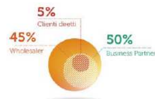
provenienza nuove attivazioni